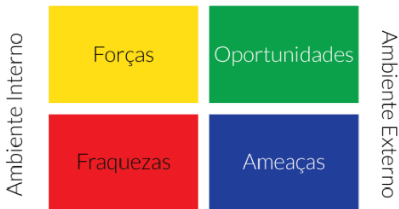
Figura 1. Análise Swot