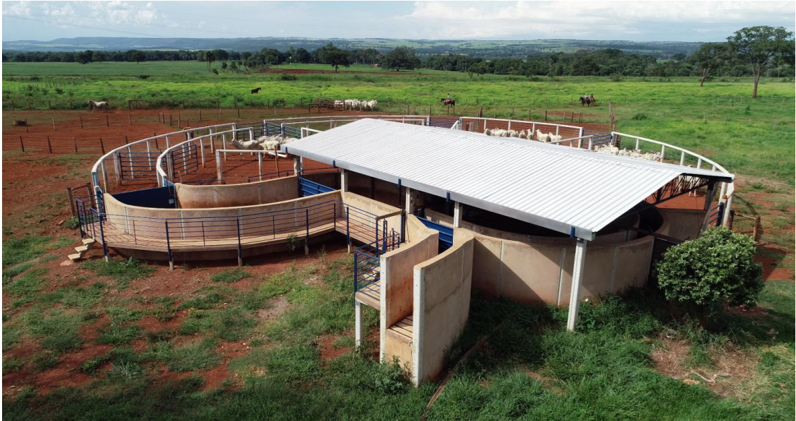
Figura 1. Vista aérea do Centro de Manejo de Baixo-Estresse da Embrapa Gado de Corte.

b) Distrações Visuais e Ruídos: Objetos que balançam, reflexos brilhantes ou ruídos agudos causam relutância em avançar, levando a parada ( balking ) (Grandin, 1993, 1997, 1998) O gado também empaca diante de poças de água, grades de drenagem e manchas de luz brilhante (Grandin, 1997, 1998);