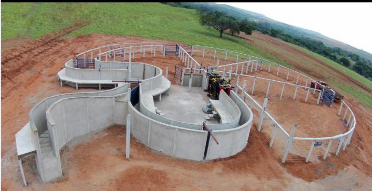
Figura 3. Vista do Centro de Manejo de Baixo-Estresse da Embrapa Gado de Corte.